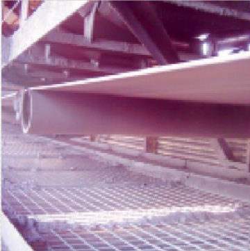
Rulmecan hihnanohjausrulla estää hihnan rikkoutumisen