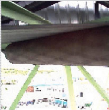
Rulmecan hihnanohjausrulla toiminnassa